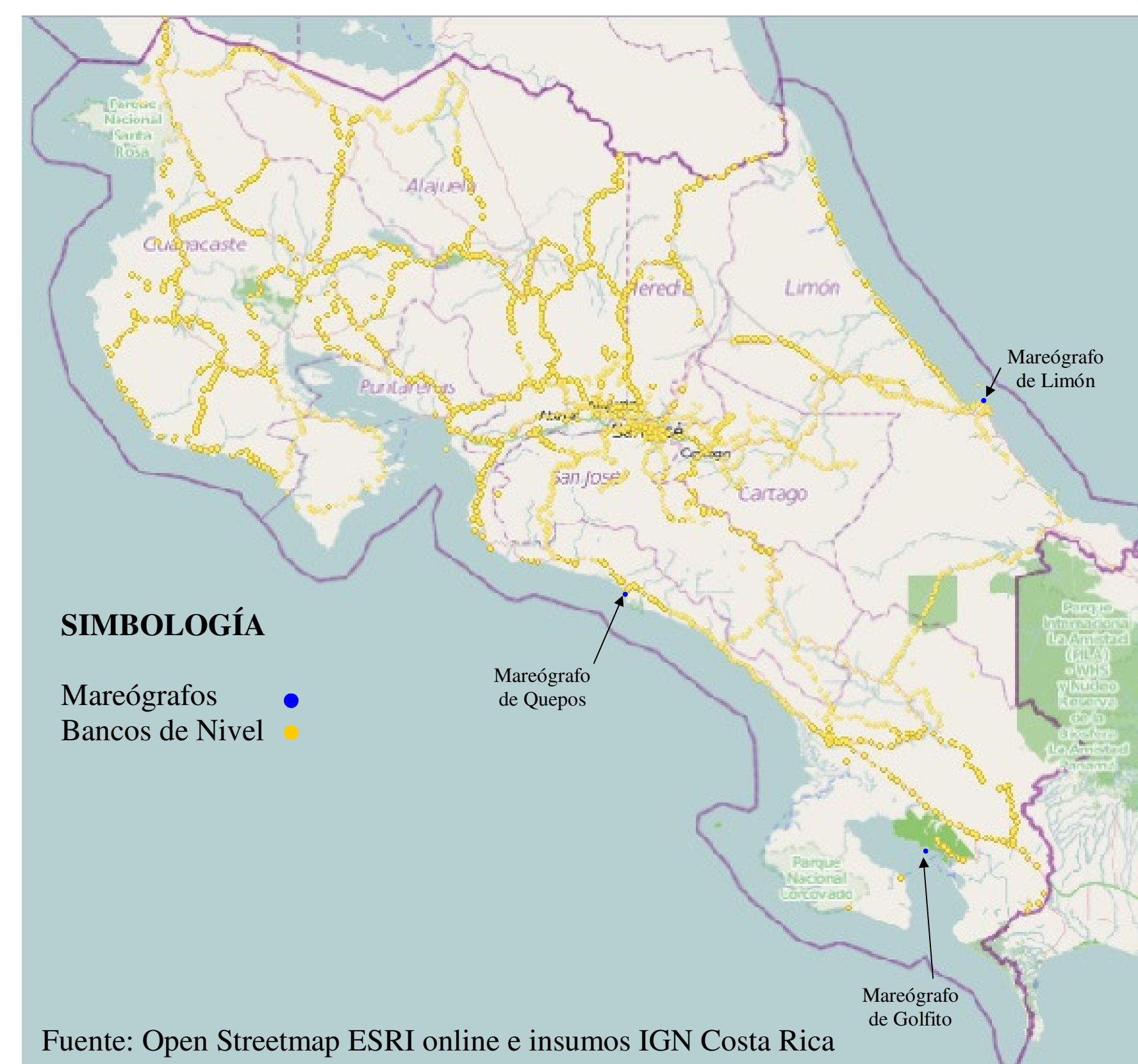
Figura 1: Base de datos de Bancos de Nivel del IGN-CR

Para el desarrollo del proyecto se cuenta con insumos del Instituto Geográfico Nacional de Bancos de Nivel, sin embargo son de los años 1958-1962. Puntos que se representan en la figura 1.